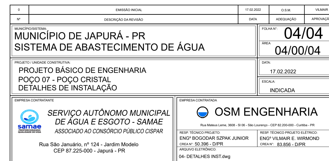
DETALHE POÇO SEM ESCALA